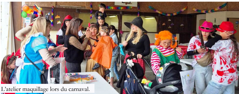
L'atelier maquillage lors du carnaval.

Malgré le temps maussade, une cinquantaine de personnes sont venues grîmées et déguisées pour fêter le deuxième carnaval d'Araujuzon. La commune d'Audaux avait prêté un char, magnifiquement décoré par l'équipe du comité des fêtes, qui a fait deux fois le tour du village. Puis les petits et grands ont continué l'après-midi avec des jeux et un gouter .